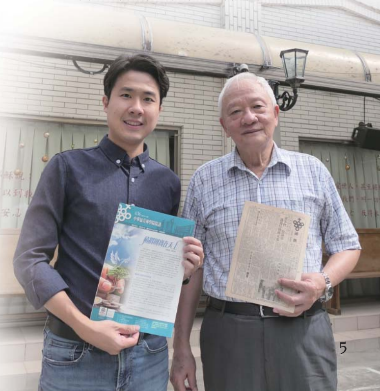
◎《華神院訊》從1970年11月出刊至今五十三年，最後一期的訪談，兩代人回到士林承恩堂（華神創校校址）細說講不完的華神故事、數不盡的上帝恩典。

蔡 ：我們還有機會讓他們了解華神的優勢和特色。祝願《華神院訊》的改版順利，並且能夠繼續以聖經真理回應時代，在時代中為教會發聲。