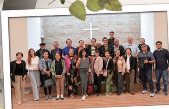
Global Filipino Movement Foundation INC. 菲律賓牧者團隊參訪華神