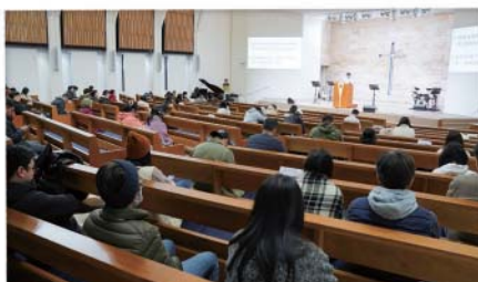
學期末感恩見證會