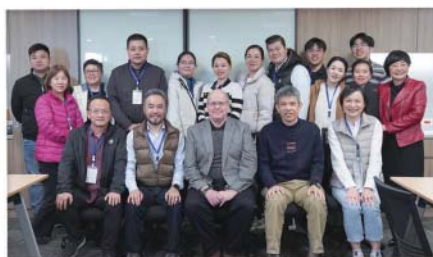
國際歐華神學院來訪華神