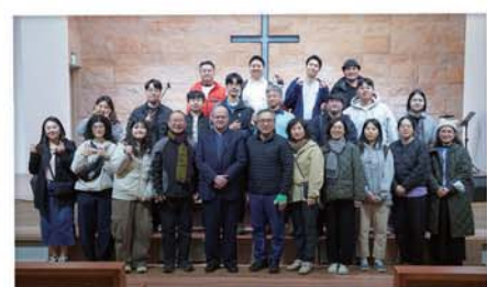
首爾神學院宣教部來訪