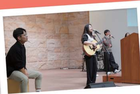
學期末感恩見證會